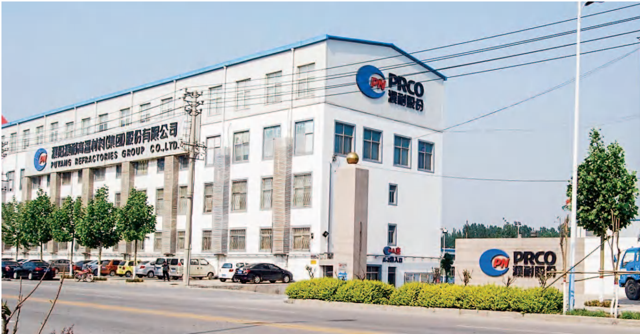
濮阳市首家上市企业——濮耐股份