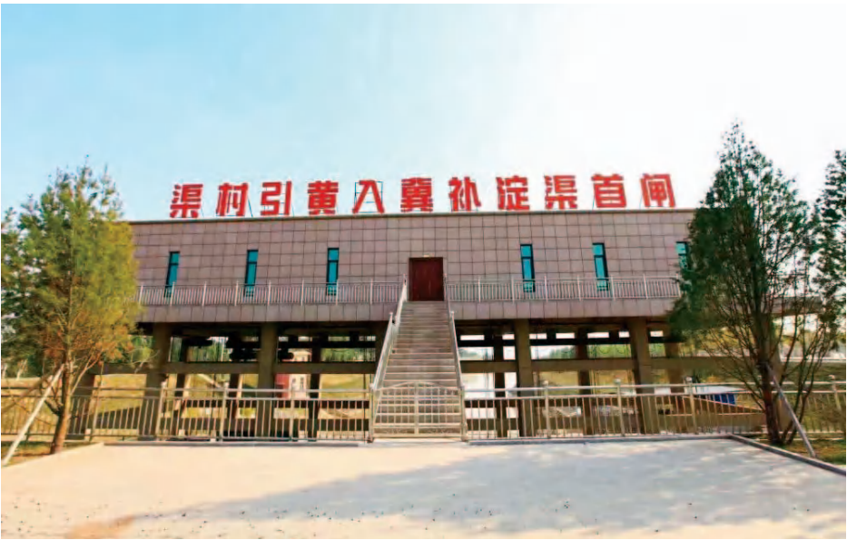
引黄入冀补淀渠首闸