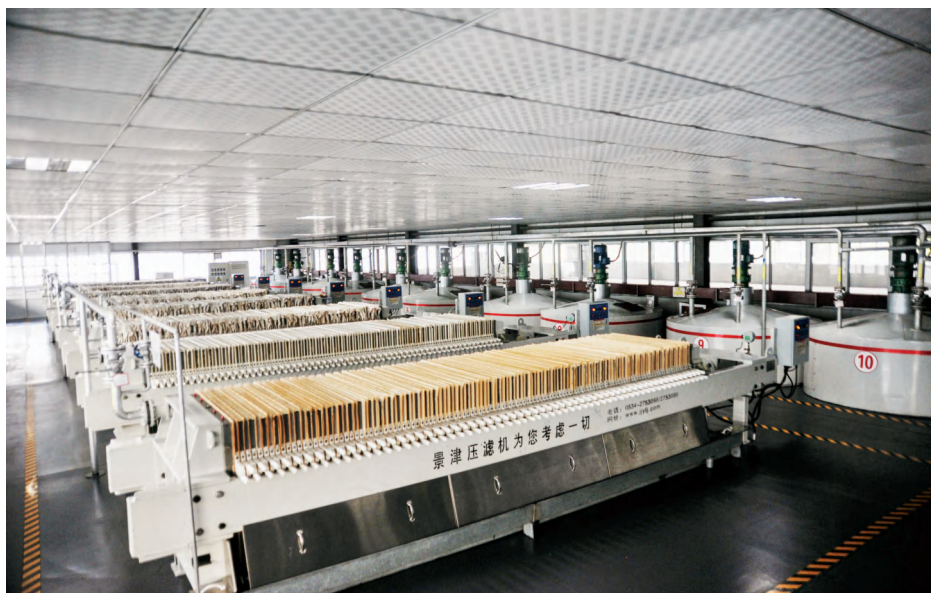
训达粮油公司精炼车间