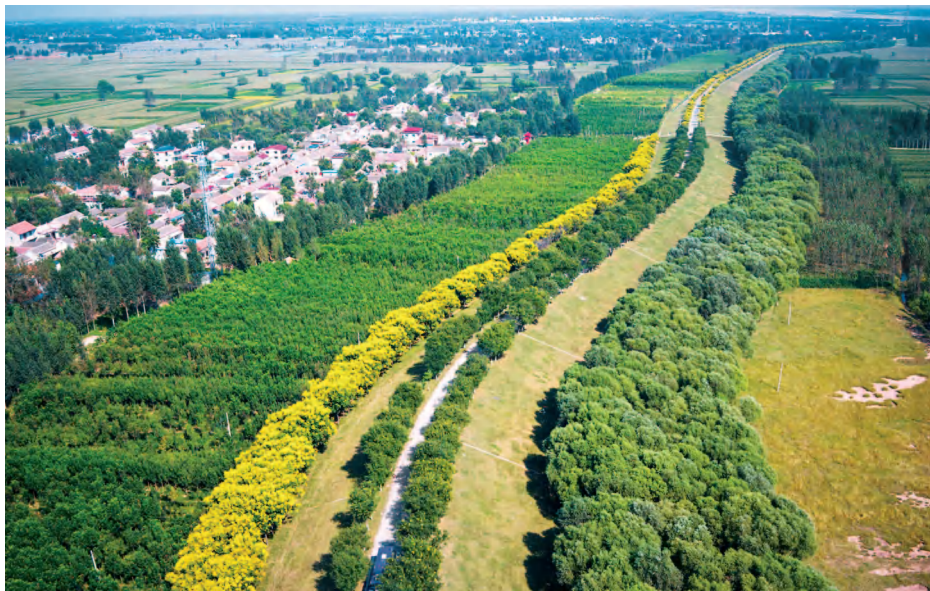
濮阳县境内的黄河大堤