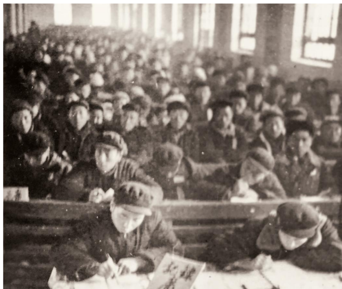
濮阳县第一次党代会