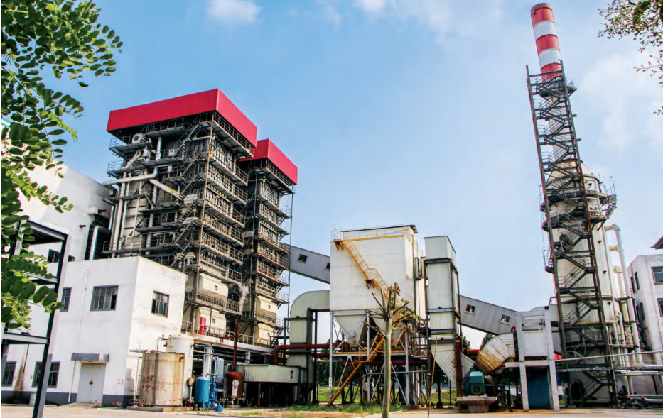
蔚林化工厂区一角