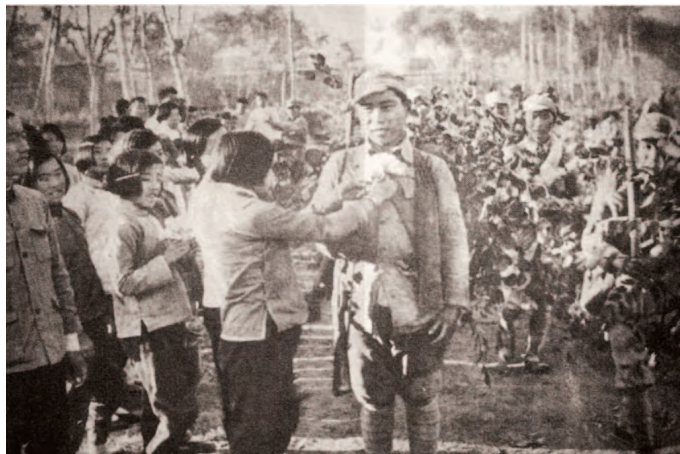
濮阳人民欢送青年参军