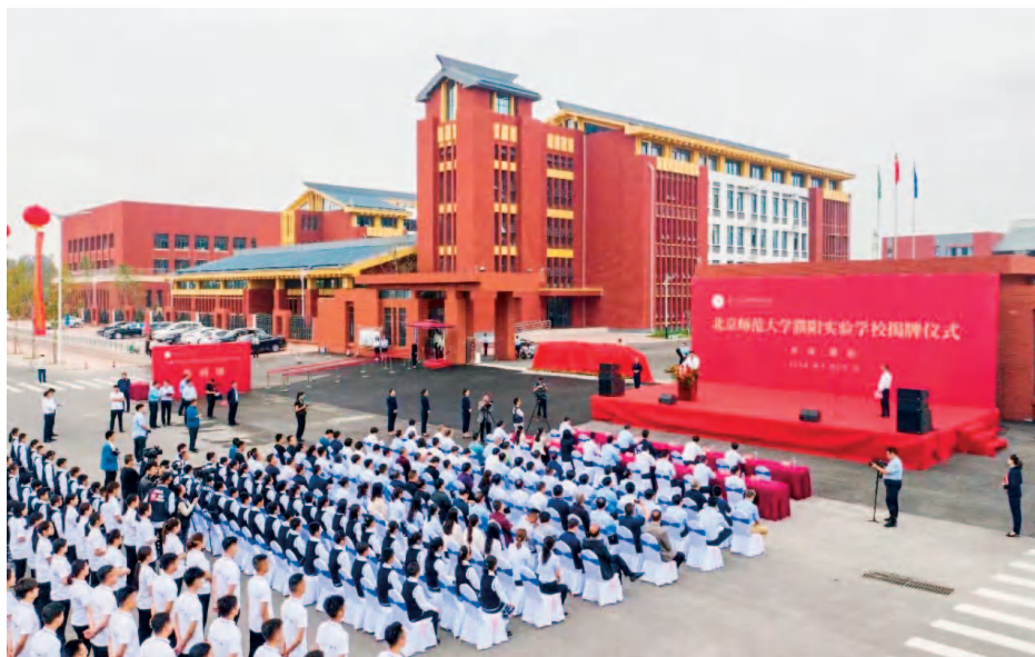
北师大濮阳实验学校