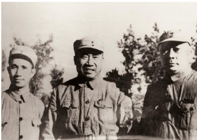
朱德、陈毅、粟裕在濮阳