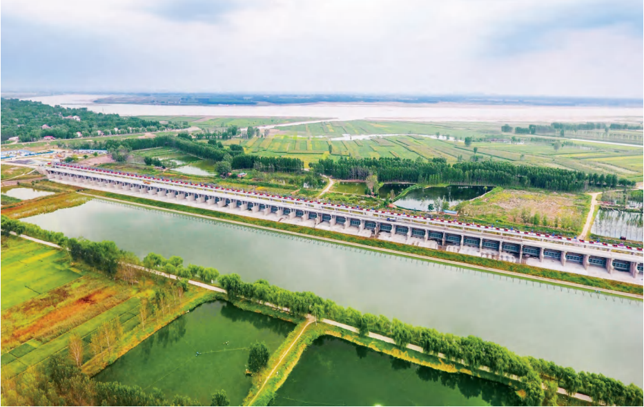
亚洲第一闸——渠村分洪闸