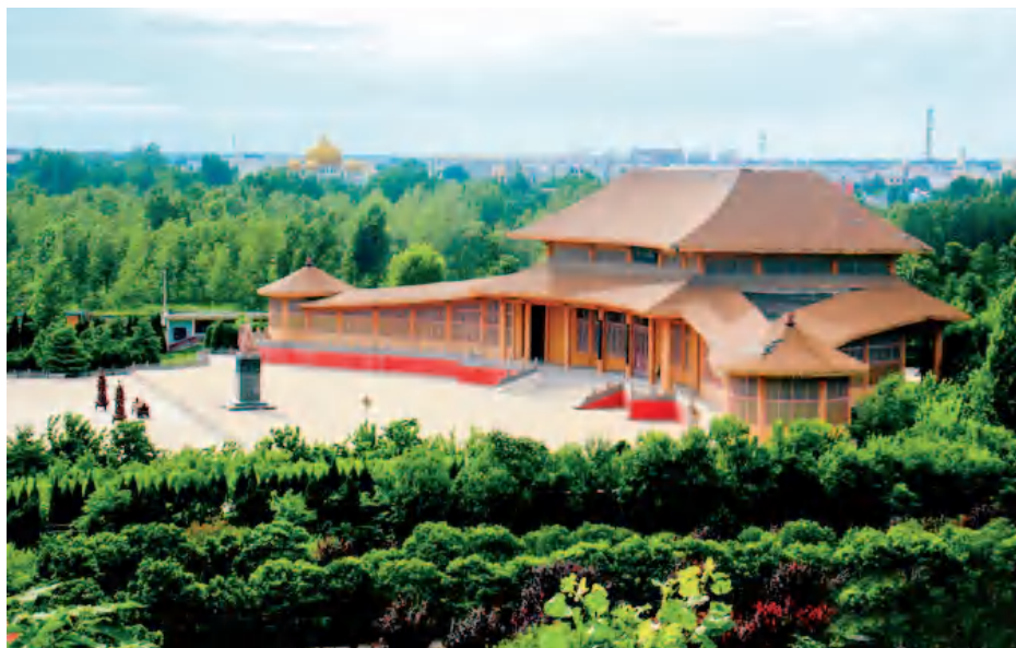
挥公园千亩森林公园