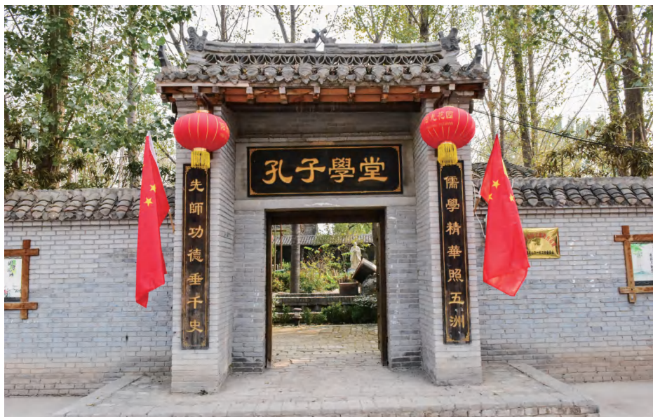
渠村乡公西集村孔子学堂