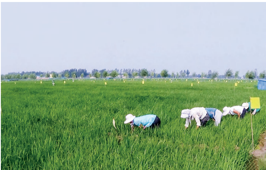
有机水稻生产基地