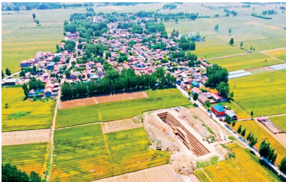
卫国故城遗址发掘