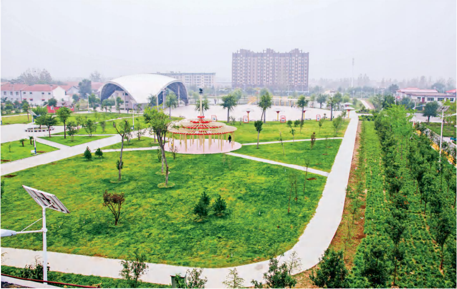
庆祖镇西辛庄村市民文化广场