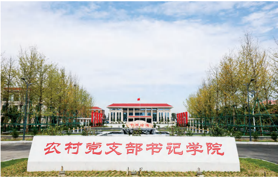
全国首家农村党支部书记学院