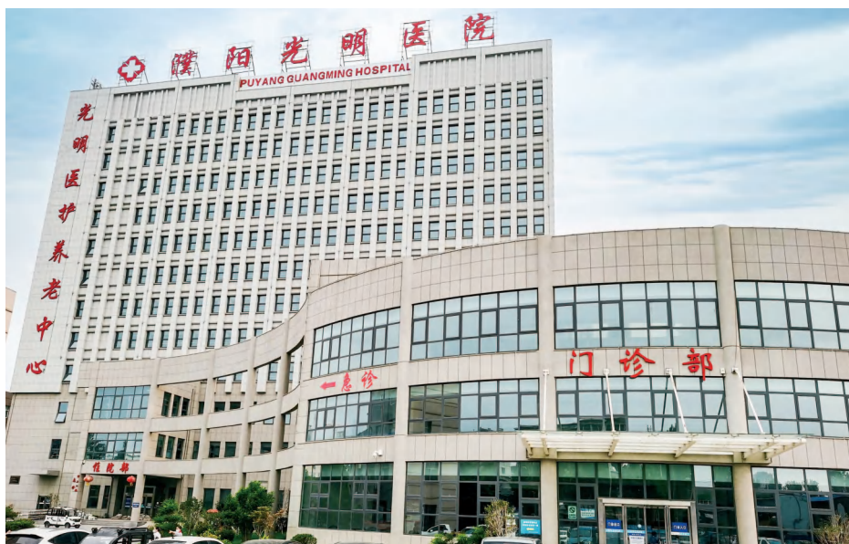
濮阳县首家医护养老中心